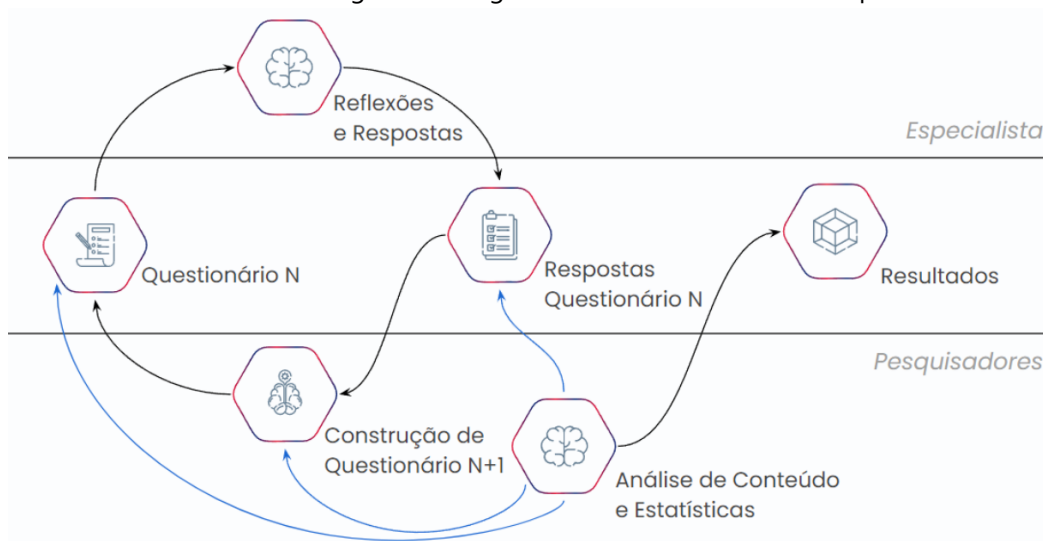
Figura 1 - Diagrama do Fluxo do Método Delphi