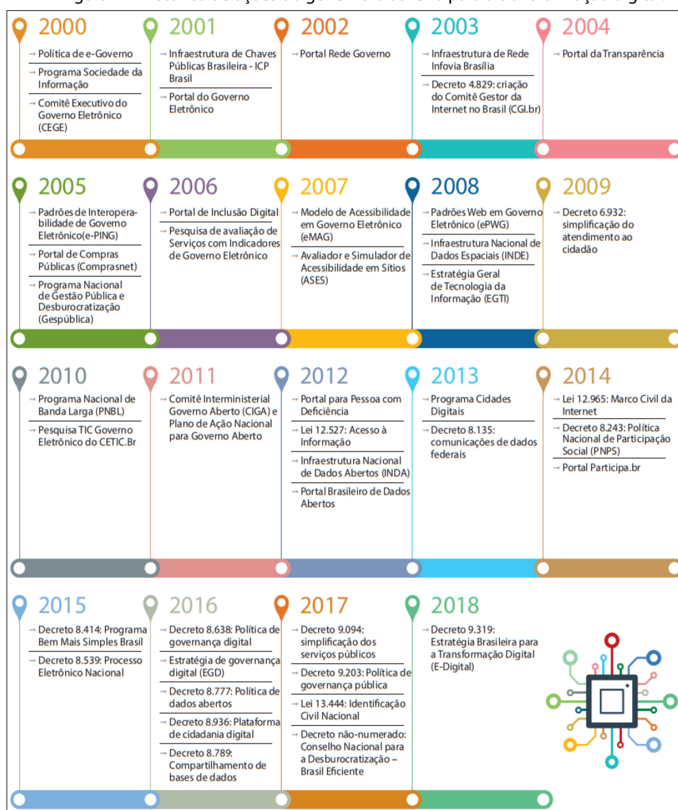
Figura 2 – Histórico de ações do governo brasileiro para a transformação digital.

Com o intuito de evidenciar as principais ações do governo brasileiro, no âmbito da administração pública federal, para ampliar o uso das TIC e melhorar a oferta de serviços públicos digitais, apresenta-se a Figura 1, que exibe uma linha do tempo referente ao período de 2000 ao início do ano de 2018, com um breve histórico das ações do governo: